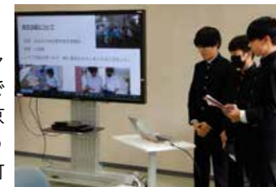
活動発表では、たくさんのアドバイスをいただきました！

留学生を含む多様な大学生と交流することで、中学生からは「未来の自分を想像することができた。時間をかけて進路を考えたい」「夢の追い方は一つではないと気づいた」等の感想があり、将来の姿や地域社会との関わり方を想像し、進路について考えるきっかけとなりました。今回得た気づきや学びを、3年次で行う職場体験等の地域実践へとつなげていきます。