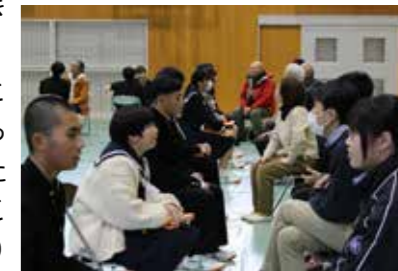
出されたお題について、高校生も大人も一生懸命に話していました。