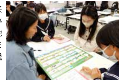
対話やゲームを通してキャリアを考えました。