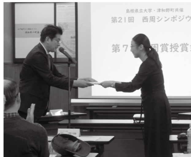
第 7 回西周賞授賞式（藩校養老館）

町では津和野出身の啓蒙思想家西周の業績を顕彰するため、島根県立大学の後援を得て「西周賞」を創設し、西周に関わる論文を公募しています。第7回目となる今年9月上旬に選考委員会が開催され、『西周新全集』代表編集者などで構成する6名の選考委員の審査によって受賞者が決定しました。