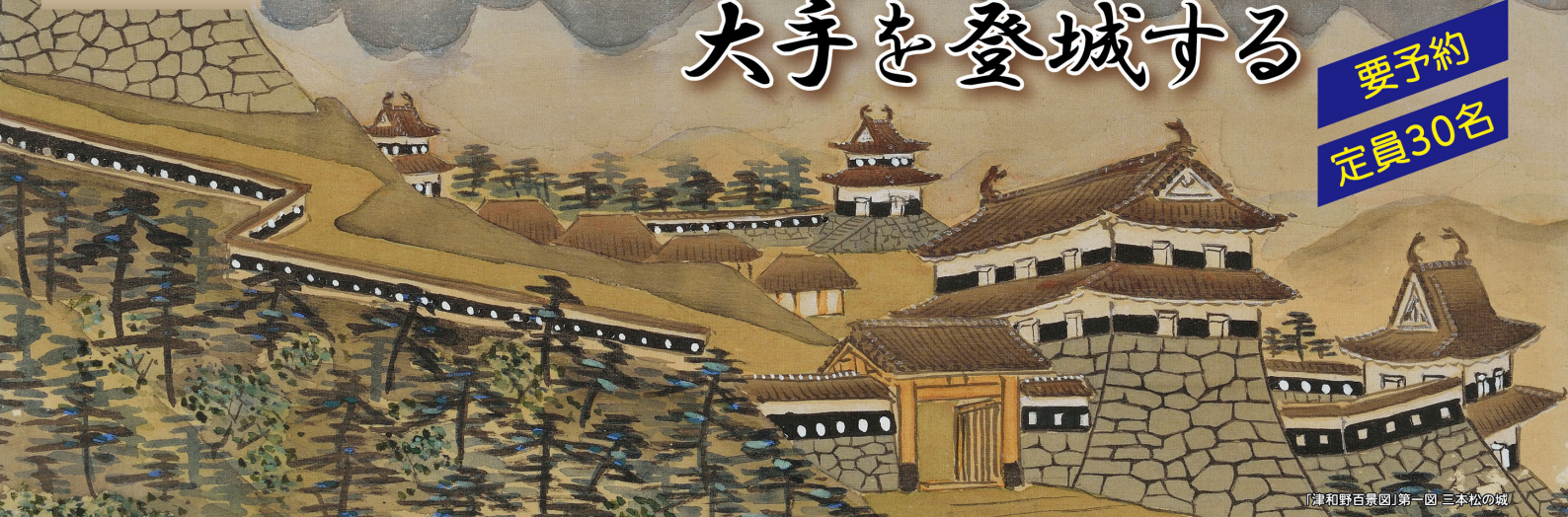
「津和野百景図」第一図 三本松の城