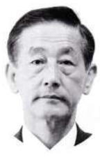
剛 洗手 議員 民間企業 業のノウハウをまちづくりに活用すべく、シャープ株式会社と連携した高齢者等の見守り及び買い物支援に関する取り組みを進めるとしているが、実施時期並びに実施範囲については。

A 高齢者の見守りや買い物支援に町内で50世帯程度を抽出し、実証試験を実施するとともに本稼働を目指す