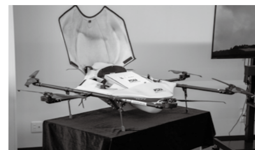
実証実験で利用したドローン

今年度、買い物支援対策として、地域活性化複合施設（枕瀬 975 番地 1）の建設を進めており、その機能を更に発展させ活用することを目的に 12 月 19 日（火）から 12 月 21 日（木）の日程において、ドローン配送実証実験を行いました。 当町をはじめ中山間地域においては、人口減少や少子高齢化の進行による、生活支援が重要な行政課題となっており、住み良いまちを構築するためには、日常の買い物など生活利便性の維持が求められています。また、運送業界においては、人手不足や採算性から特に過疎地域における配送維持が課題となりつつあり、今回は、「食料品や日用品等をドローンの配送を行うことによる『買い物難民』と『災害時の緊急物資配送を想定した非常食や防災用品をドローンの配送を行うことによる『災害時の孤立地域発生』」を想定し、実証実験を行いました。 本実証実験にあたっては、KDDI スマートドローン株式会社（東京都港区）、株式会社ネクストデリバリー（山梨県小菅村）のご協力のもと、地域活性化複合施設を起点として、道の駅シルクウェイにはらと野地公民館の 2 地点を配送地点に設定し、2 ルートの開拓を行うことができました。 ドローンの活用は、生活支援としての物資配送にとどまらず、災害時の被災状況確認や救援物資配送など様々な活用方法が可能となります。今後、実装に向けた、具体的な活用方法を検討してまいります。