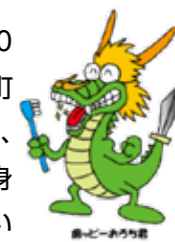
島根県歯科医師会 PRキャラクター

津和野町では、厚生労働省と日本歯科医師会が推奨している「80歳になっても自分の歯を20本以上保とう」という8020運動を実施しています。また、津和野町健康で生きがいのある町づくり会議の「食と歯の部会」では、お口の健康に関心を高める目的で歯周疾患検診（70歳）で、20本以上自分の歯がある方を増やす「7020運動」にも取り組んでいます。歯を失うと、全身の健康に影響を与えることもあります。年に1回は歯科検診を受けて、歯みがきで取りきれない部分の歯垢や歯石を専門家に除去してもらうことで健康なお口につながります。