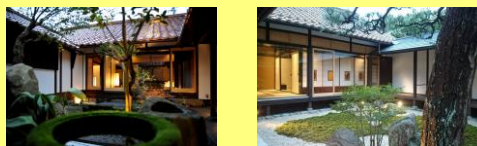
整備後(簡易宿泊所として活用)