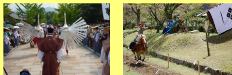
津和野弥栄神社の鷲舞