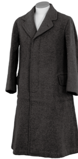
愛用の外套 漢詩書幅