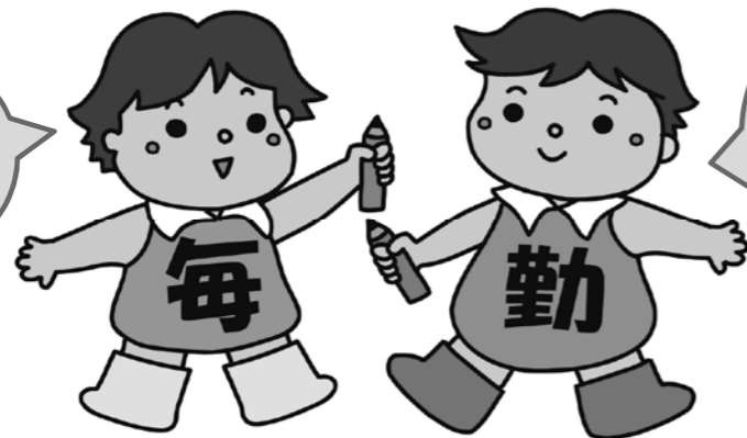
毎月勤労統計調査のキャラクター「まいちゃん きんちゃん」

調査の結果は、 景気の判断や、 社会保障制度を 検討するときの 資料として使わ れます。