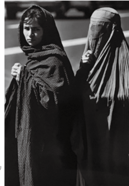
アフガニスタンの首都カブールで民族衣装のチャドリを被った女性(1988年)