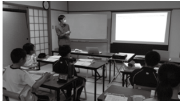
津和野教室の授業の様子

スタッフは、新しい学びに目を輝かせ、わくわくした様子の新1年生に大きな刺激をもらいました。生徒の皆さん、これからよろしくお祈いします！