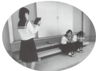
ムービー作成の様子

ツコウは自分の「やってみたい！」を地域の方々と魅力化コーディネーターのみなさん、先生方が応援してくれる学校です。ぜひ一緒にツコウライフをエンジョイしましょう！