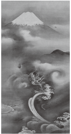
☎72-0300 岡野洞山筆 富士越龍の図(部分)

郷土館では、津和野の文化や歴史を物語る郷土資料の収集・保存・公開を行っています。本展では 2019 年度までに郷土館が収集した、津和野藩主亀井家に関する古文書や美術品を紹介します。なかでも、鯉の絵で有名な日原出身の画家伊藤素軒(明治～大正時代)が鮎や紅葉を描いたものや、津和野藩の御用絵師岡野洞山による迫力ある龍の絵など、貴重な作品の初公開です。この機会にぜひご来館ください。