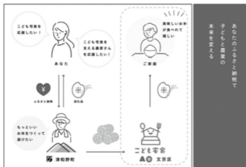
子ども宅食プロジェクト

4月14日(火)より、ふるさと納税の仕組みを活用したガバメントクラウドファンディングによる食の交流事業が開始されました。集まったご寄附を使用して、文京区の「子ども宅食プロジェクト」を利用する経済的に困難な区内のご家庭約600世帯へ津和野町産のお米をお届けします。また一部は町内の米作り農家さんの土作りへ充てられます。さらに寄附者へも返礼品として同じお米をお送りして、両自治体の取り組みに関心を持っていただき、新たな繋がりが生まれることを期待しています。 第1期は350万円を目標金額とし、6月30日(火)まで受け付けておりますので、町外にお住いのゆかりのある方々へお知らせください。 ※4月30日(木)までに日本経済新聞、都政新報、スポニチアネックス(WEB)、東京新聞に掲載いただきました。