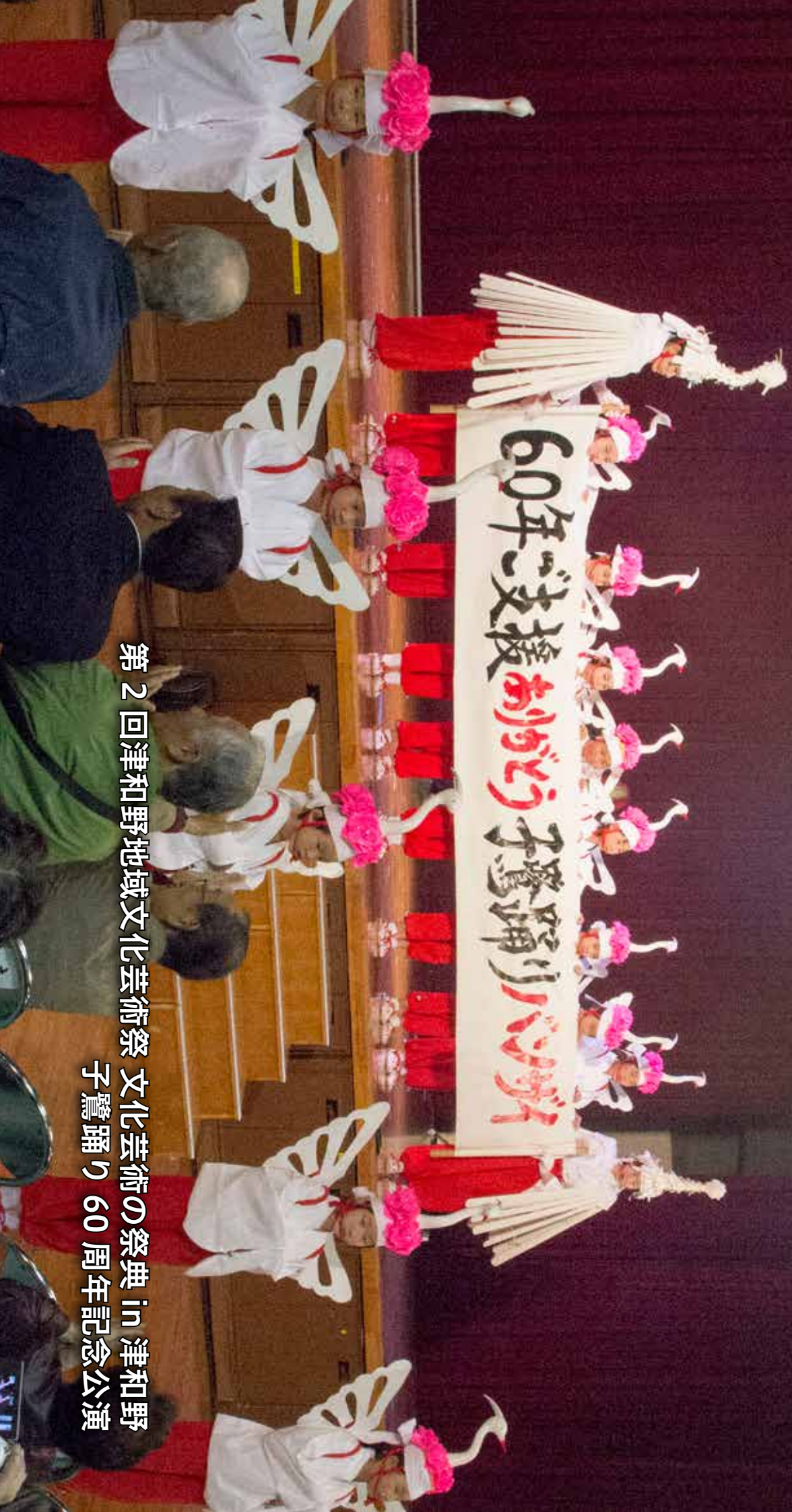
第2回津和野地域文化芸術祭 文化芸術の祭典 in 津和野 子鷺踊り 60周年記念公演

子ども達の情操教育と郷土芸能のため、昭和33年に故・田中良氏によって小鷺踊りが創作されました。今年で60年を迎えた小鷺踊りは、のべ3,000人以上の子ども達に踊り継がれ、津和野を代表する芸能のひとつとして息づいています。