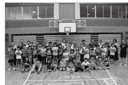
参加者みんなで集合写真

この日は町内からおよそ38名が参加し、パーツごとにバラバラの状態からロボットの組み立て、パソコンを使ったプログラミングでロボットを動かします。そのロボットを使って用意されたコースのクリアをめざし、ロボットの動きを決めるプログラミングを修正する作業を繰り返します。 実際に自分で作成したプログラムが思い通りに動かない難しさを体感し、試行