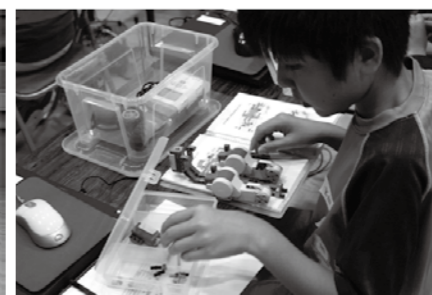
説明書を見ながらロボットを組み立てます

錯誤でコースクリアをしたときには嬉しそうな声が参加者から上がっていました。 津和野町ではITをキーワードに企業誘致などの産業振興に取り組んでおり、若年層を対象とした教室のほか、様々な事業を展開しています。