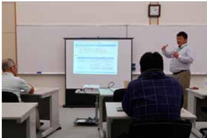
専門スタッフによるわかりやすい講習

津和野町では、これからの IoT/ICT の活用へ向け、情報分野の技術を仕事に活用できる人材の育成を目的とした各種講座を開催しています。パソコンに関する基礎知識からオフィス業務に役立つソフトの使い方、さらにはクラウドサービスの導入など、今後ますます必要性の高まるこの分野で活躍できる人材の育成を目指しています。