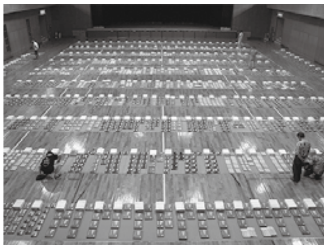
体育館いっぱいに広げられた教科書類

点数の計算の仕方、勝ち負けの判定の仕方などゲームのルールから自分たちで考え、ゲームに登場するキャラクターをイメージ通りに動かすプログラミングを作っていく作業。苦戦しつつも、自分でイメージした通りの動きをプログラミングできたときには大きな歓声が上がり、周りの参加者にも、うまくいくプログラミングの作りかたをアドバイスするなど、参加者同士で教えあう光景をみることができました。