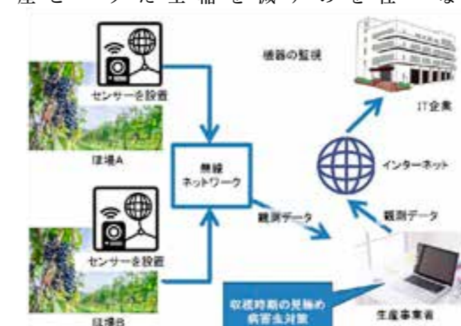
図 1. ブドウの生産管理における IT 導入の事例

また、ある会社では、稲作栽培を行う農業事業者の高齢化・リタイアに伴う生産量の減少、後継者不足を解消するため、稲作の作業時間や生育状況を撮影した写真などをデータセンターに蓄積。そのデータをもとに作業時間や生産コストの分析を行い栽培管理の改善に活用しているといった事例もあります。 2 つの事例に共通するのは「データの蓄積」は、これまで農業の分野で、生産者の方の長年の経験により習得してきた栽培ノウハウを可視化することを可能にしました。これにより後継者育成や新規就農を希望する方が短期間でそのノウハウを習得することも可能になりました。 農林水産省が実施した農業