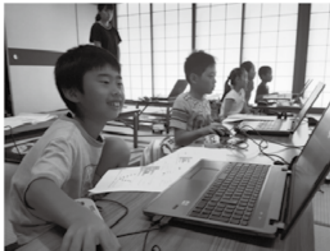
楽しそうにパソコンを操作する子どもたち

元気に遊ぶ子どもたちに対して、それを支えるスタッフたちは、地域で子どもを育てるとい理念の下、全員が子どもたちに真剣に向き合い、協調性を育めるよう導いていました。参加者にリピーターが多いのも、この理念が伝わっているからでしょうか。イベントが回数を重ねるごとに、この思いが地域の枠を越えて広がっていくことが望めます。