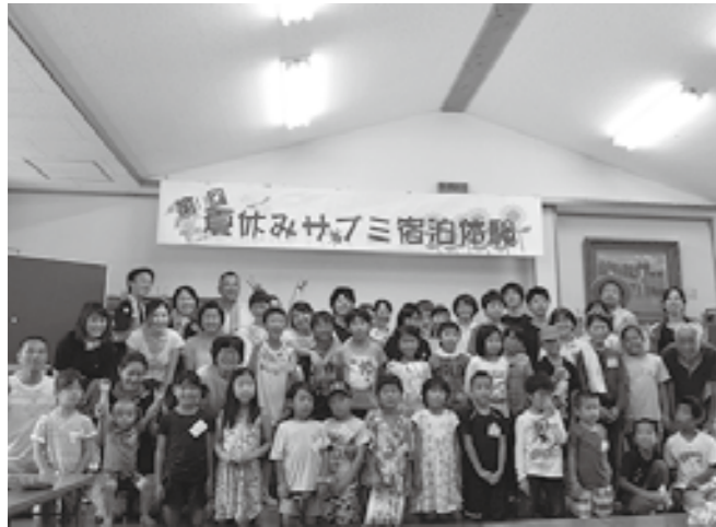
楽しい日々はあっという間に過ぎていきました