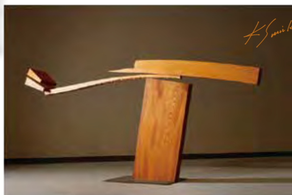
(そのあるかたち) 1980年 埼玉県立近代美術館蔵

東京スカイツリー®のデザイン監修などで知られる彫刻家・澄川喜一の魅惑の立体世界。初期から近作まで約80点で振り返ります。