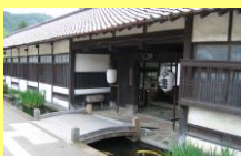
津和野藩校養老館