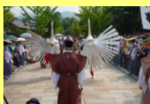
津和野弥栄神社の鷺舞