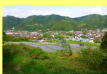
国道9号から見る棚田と街の風景