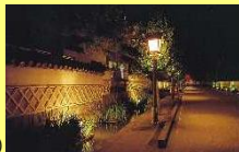
夜の殿町(イメージ)