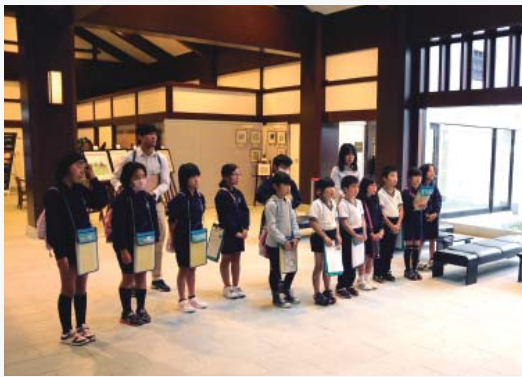
美術館を訪れた津和野小学校4年の生徒たち。

美術館を訪れた生徒たちは、「旅の絵本Ⅷ 日本編」の津和野が描かれている場面など、熱心に見入っていました。