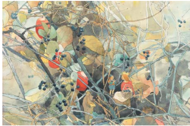
「野の花と小人たち」から「からすうり」。◎空想工房

なかでも、私たちの身近にある草花を題材にした「野の花と小人たち」から「からすうり」。