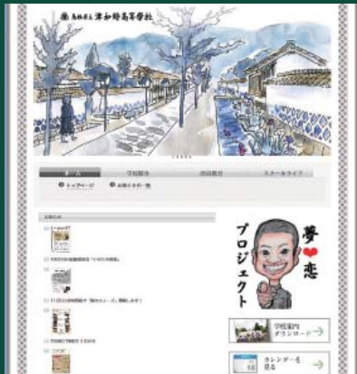
島根県立津和野高等学校 HP アドレス http://www.tsuwano.ed.jp

高校では、ホームページ以外にも、インターネットを通じて利用者同士で情報のやり取りができる SNS サービス・Facebook などの更新も行いながら、高校の情報をお知らせしています。