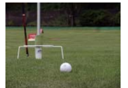
健康と福祉の向上を目的に、グラウンドゴルフ場がオープンしました。

加えて、災害の影響で町の観光や商業分野にもマイナスの影響が出ており、これらについても関係団体との連携を図りながら、町が進める歴史