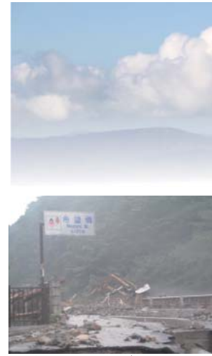
早期復興を目指して作業が行われています。

まずはこれまでの1期4年間、皆様には町政に対してご理解、ご支援を賜りまして誠にありがとうございました。順風満帆とは到底言えないながらも、地方にとって非常に厳しい時代において、財政健全化と活性化の取り組みを両立していくことは試行錯誤の毎日でありましたが、それ