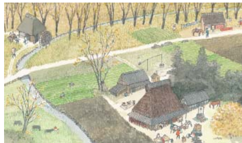
「旅の絵本Ⅷ 日本編」の一場面。◎空想工房

この「野の花と小人たち」の展示は、十二月十二日（水）までです。ご家族、ご友人とお誘いあわせの上、ぜひお越し下さい。なお、十二月十三日（木）は、冬期展示替えのため休館いたします。