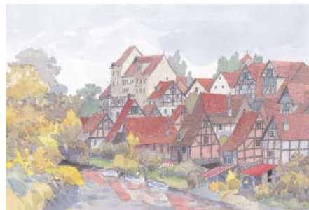
「歌の風景」から「菩提樹」。◎空想工房