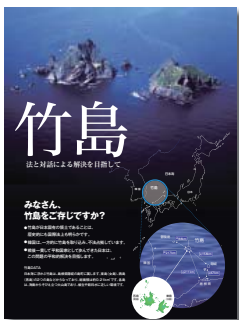
外務省が制作した「竹島フライヤー」（啓発用チラシ）。

これらの啓発資料は、首相官邸のホームページ（以下「HP」）の「竹島問題について」、外務省HPの「竹島フライヤー」、島根県HP「Web竹島問題研究所」などで閲覧できますので、ぜひご覧ください。