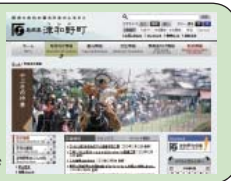
新しくなった町のホームページ