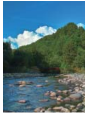
省エネ環境を良くするために、小さな工夫が大切です。

安に衣類を一枚多く着てこまめな調整をしよう ④お湯が冷めないうちにお風呂に入り追い炊きを最小限に ⑤必要ない電化製品の電源はこまめに切る ⑥電化製品を買い替える時は省エネタイプの確認 ⑦クルマのタイヤの空気圧を適正にし、『急』な操作をしないように ⑧冷蔵庫をあける時間は最小限にし、季節にあわせて温度調整を このほかにも身近なことからできる省エネ活動はたくさんあります。できることから始めてみましょう！