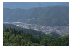
歴史ある町を後世に残す取り組みも始まっています。

これまでの4年間は皆様の町政に対する期待や様々な思いを最大公約数として町政に反映することを心がけ、各地域での町政座談会、各種団体