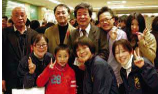
映画監督・高畑勲さん(2列目真ん中)を囲んで皆で記念撮影