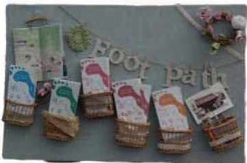
4人が材料から仕入れ手作りしたマップホルダ