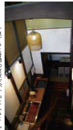
「一階部分の改修工事の町家客が、中に入ると、横並びの町家客室が完成して、現代的な設備も併せ備わったのが特徴です。」

まちなか再生事業は現在、後田地区の物件整備・活用を目的として、町家再生事業が本格的にスタートしました。この物件は町家ステイ（町家は再生した浦在施設）として活用される予定で、平成24年度中に実施設計を行い、25年度で改修、早期の開業を目指します。