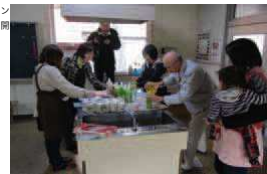
先日も異文化交流・インド舞と踊ったサロンが開催されています。