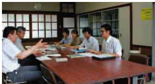
マップの方向性などについて町長とも複数回の打合せを行った。