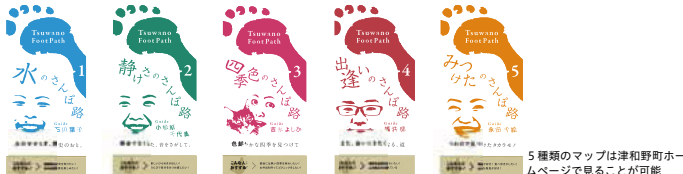
5種類のマップは津和野ホームページで見ることが可能

「フットパスは学生だけではなく、町にいても人みんなで作ってこそ面白いものです。ぜひ一度は手に取って、町を歩いているときに、この町の良さを改めて感じていただきたいと思います。また、来年度も引き続き、マップの作成を行いますので、マップについていろいろという方は学生まで一声お願いします。」