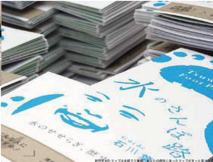
制作されたマップは全部で5種類。あなたの感性にあったマップがきっと見つかる