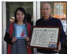
表彰状と記念賞が島根県より贈られました。

島根県が主催し、子育て支援に積極的に取り組んでいるグループや「こころ協賛店」を毎年表彰する「こころ大賞」(ぴよぴよサロン)が「こころ大賞」を受賞し、2月7日に浦口知事より表彰を受けました。 ぴよぴよサロンは、1、2ヶ月1度、お薬作りなどを通じて、子育て中のお母さんのリフレッシュと交流の場として開催されています。お子さんと一緒に、ぜひ一度参加してみたいかですか? ぴよぴよサロンの開催等については詳しくは青原公民館(☎75-1003)までお問い合わせください。