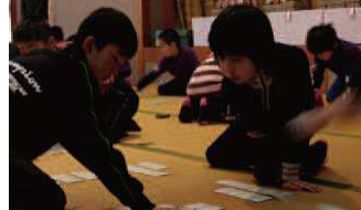
いかに集中を途切れさせないか、かるたは自分との闘いでもあります。

選手たちが札を読み上げる読手の声に神経を研ぎ澄ませると会場は緊張感に包まれ、下の句の札を取られる際には静まり返っていた会場には札と畳をはたき音が鳴り響きました。この日会場となった太鼓谷稲成神社では選手たちは、静寂のなかの真剣勝負に臨んでいました。