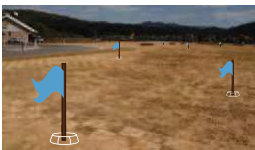
完成イメージ図(参考)