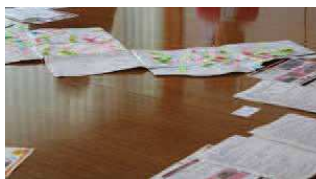
見落としがちな小さな発見を促してくれるのがこのマップの特徴。様々な資料を基に、マップに情報を落とし込みながら制作が進められた。

「この町の日常は観光客にとって魅力ある非日常、これをマップ制作に活かさないか。」 そこで考えた彼らは、地図を広げ、自分たちがこれまで「おもしろい」と感じた部分に印を付け、制作に取り組んだ。その段階では、他のメンバーが勧めるポイントが本当にマップに載せるべきか検討し、実際に足を運び、時には実際に観光客に歩いてもらった。また、限りある紙面のスペースの中で、どれたけ町の良いポイントを載せるか、あるいはそれらの魅力をどう伝えるか、本当に他の観光客にとっても魅力のあるマップになっているか検証を重ね、制作は進められた。