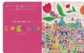
しまね子育て応援パスポート