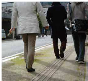
観光目的だけでなく、ウォーキングをする際にこのマップを利用するという活用もできる。