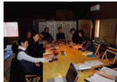
異例な表情で説明を受ける旅館組合関係者

津和野町家ステイは、「津和野の暮らしを体感する体験型」の滞在施設です。近年、観光客はその土地に強く関わって来ます。これを津和野に置き換えると、町野や本町の景観を眺めて、観光パンフの写真の「実物」を見るだけではなく、何らかの体験を通じて自分だけの津和野を発見したい、と考えられています。これまでの観光スポットを否定しているのではなく、五感で楽しめようというお店の、仕立て上げたいのです。