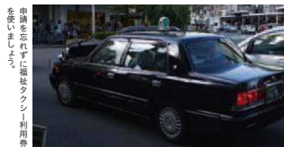
申請をせずにタクシー利用券を使っています。

申請場所 □総合窓口(本庁舎) □福祉事務所 津和野町 申請の際には印鑑を忘れずにご持参ください。 利用券のご利用方法など詳しくは、交付申請時に説明します。