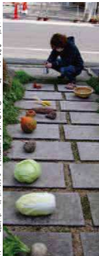
メニューボードの設置の目的に、写真撮影的な手作りで店ぐを

出来ることから始める店舗改善 またまちなか再生総合事業事務局では、空き家の再活用だけではなく既存店舗の改善プロジェクトも進めています。滞在施設開発に伴う町の魅力アップを目的とし、