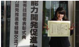
盛大な式典ですこし緊張した様子ですが、その技能は一流です。