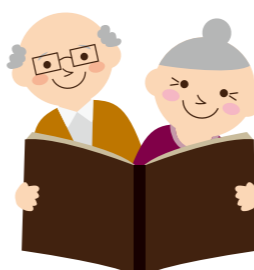
年金記録の確認をお忘れなく

時に封書の「ねんきん定期便」が送付されているため、平成25年中の誕生日には、封書ではなくハガキの「ねんきん定期便」が送付されます。 【昭和30年4月2日～昭和31年4月1日生まれの人】 こちらの方は、平成26年度中の誕生日に封書の「ねんきん定期便」が送付されます。 また35歳、45歳および58歳の節目年齢以外の人には、ハガキの「ねんきん定期便」が送付され、すでに年金を受給している人には老齢年金の見込額は知らされていません。