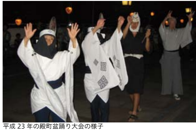
平成23年の殿町盆踊り大会の様子