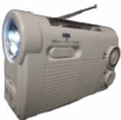
配布される防災ラジオ

津和野町では、災害対策の一環として、『手回し充電機能付きラジオ』をお配りすることになりました。これは、大規模災害が発生した場合に限り、臨時的にFM放送局を開設して、災害情報や復興情報等を放送することになり、その情報を入力するためのラジオです。 このFM放送の周波数は、災害が発生した後に総務省から割り当てられるため、平常時に放送することはありませんが、東日本大震災の後には、安否情報や支援情報等の情報が放送され、効果をあげた事例が報告されています。 【問】総務財政課 74-0028