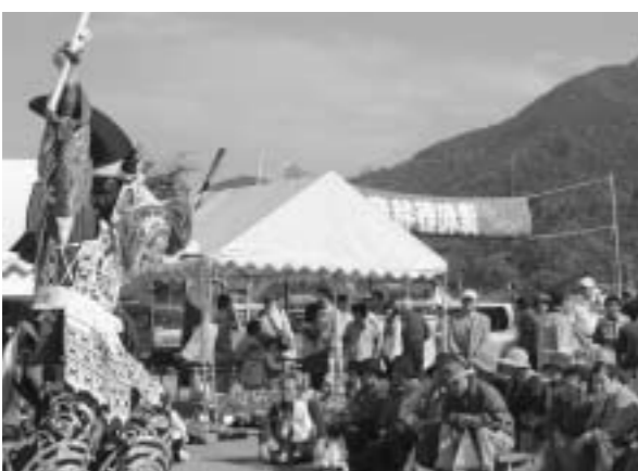
木ノ口神社中による石見神楽