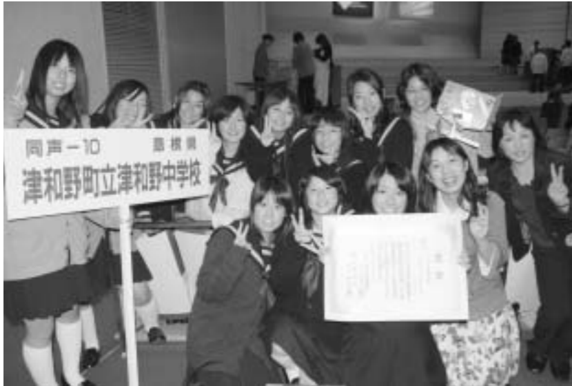
全国大会の会場で銀賞受賞に大喜び!