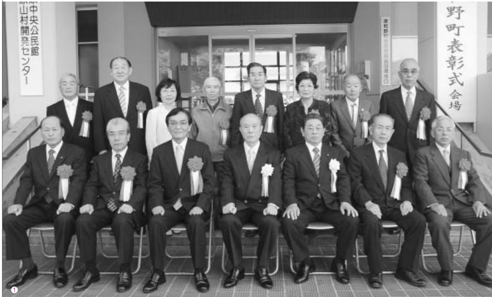
1 功勞表彰を受賞されたみなさん。 2 全日本合唱コンクール全国大会で津和野中学校合唱部が銀賞を受賞 3 道の駅シルクウェイにちはら 収穫祭 2007