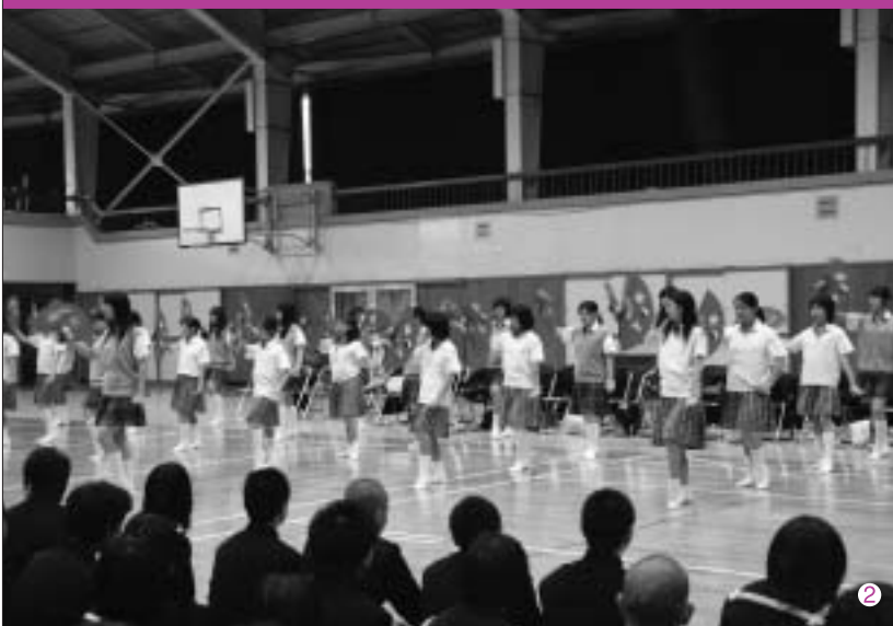
3 日原中学校が自転車マナーアップモデル校に指定