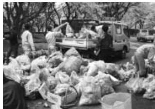
回収ごみの分別作業