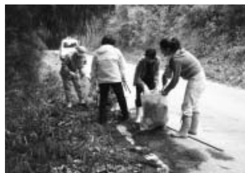
森・野坂線の収集

なお、日原地域では環境月間に併せ5月～6月中に各自治体ごとに一斉清掃が実施されますので、ご協力をお願いいたします。