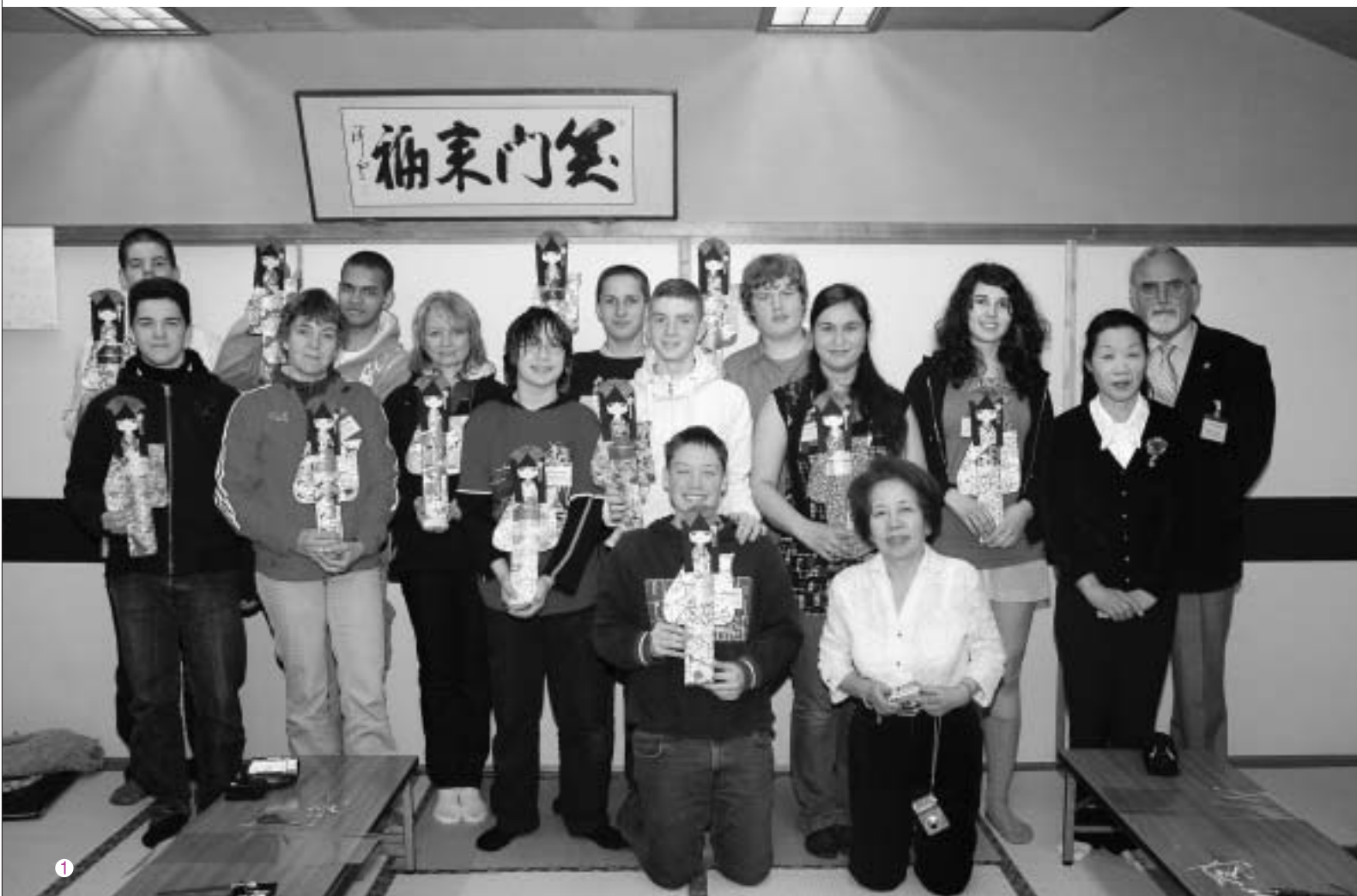
1 ベルリン友好交流訪問団来町 和紙人形作りを体験