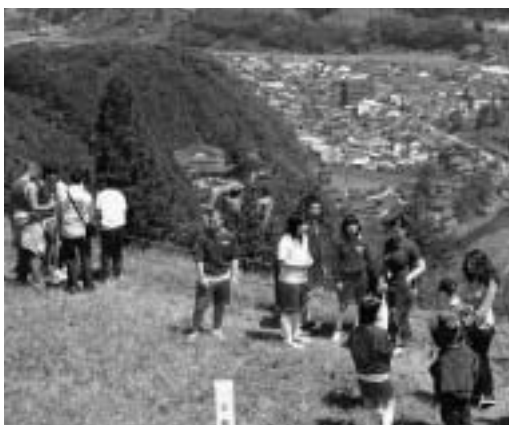
津和野中学校生徒との交流

14日から16日に行われた学校交流では、ペロリーナ学校と姉妹校の縁組を結んでいる町内の各中学校をそれぞれ訪問しました。14日に訪問した木部中学校では、バスケットボールや習字体験などを行い、15日に訪問した津和野中学校では、3年生の英語の授業で、英語で観光案内をしながら城山に登りました。また、16日に訪問した日原中学校では各学年の授業に参加し、日本の中学生の授業を体験しました。この間は、それぞれの学校でおいしい給食も味わいました。