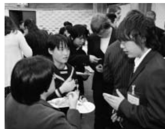
歓迎レセプションでの交流のひとつ

14日から16日に行われた学校交流では、ペロリーナ学校と姉妹校の縁組を結んでいる町内の各中学校をそれぞれ訪問しました。14日に訪問した木部中学校では、バスケットボールや習字体験などを行い、15日に訪問した津和野中学校では、3年生の英語の授業で、英語で観光案内をしながら城山に登りました。また、16日に訪問した日原中学校では各学年の授業に参加し、日本の中学生の授業を体験しました。この間は、それぞれの学校でおいしい給食も味わいました。